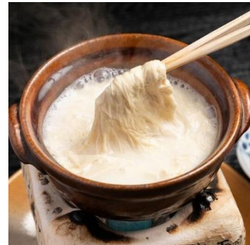
【京ゆば処 静家 二条城店】